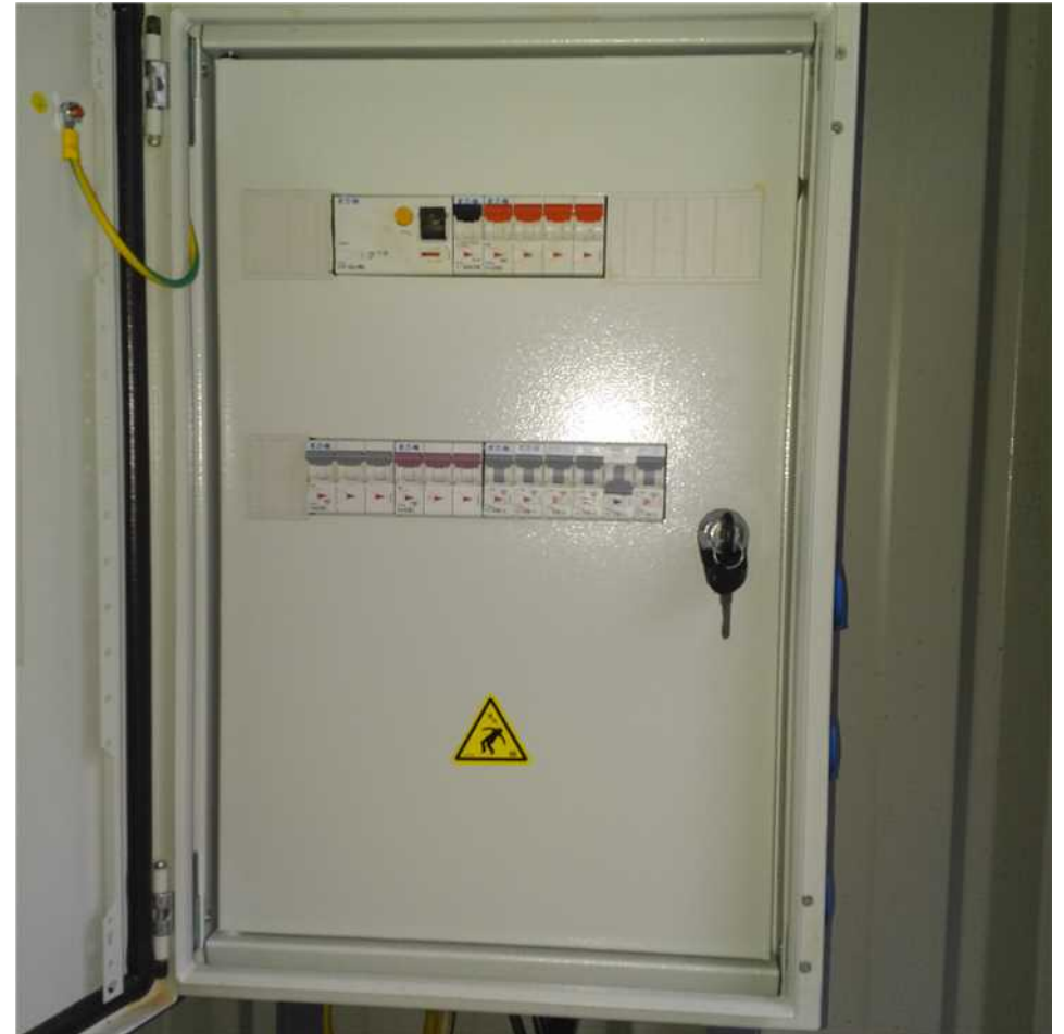
Armoire générale fermée