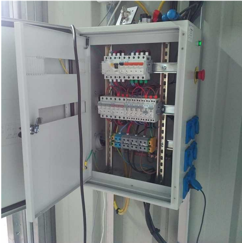
Centrale sur disjoncteur 10A (celui qui est abaissé)