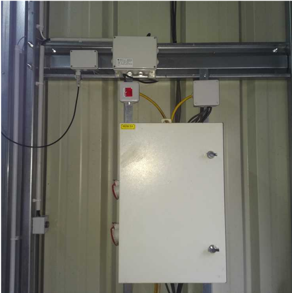
Vue d'ensemble câblage achevé